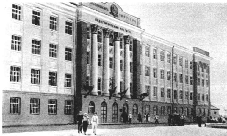
Педагогический институт в г. Энгельсе.