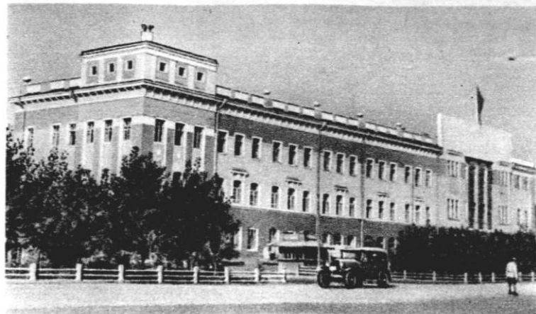
Дом правительства в г. Энгельсе.