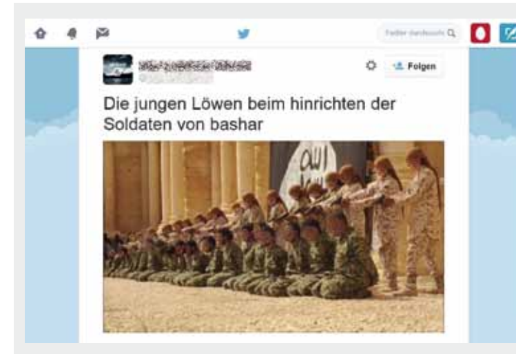
Kinder werden von Dschihadisten als Henker in Szene gesetzt.

Darüber hinaus inszenieren sich dschihadistische Gruppen auch als Beschützer und Versorger. Bilder und Videos im Netz zeigen Anhänger des IS beim Verteilen von Süßigkeiten, Spielsachen, Kleidung und Nahrungsmitteln an Kinder in den von ihnen besetzten Gebieten. Vermittelt wird die Botschaft, der Islamische Staat gewährleiste Sicherheit und Sorge sich um das Wohlbefinden der Kleinen. Auch deutsche Islamisten sind in diesen Videos zu sehen und richten sich speziell an deutsches Publikum. Sie vermitteln die Botschaft, für die gerechte Sache lohne es sich, in den Kampf zu ziehen.