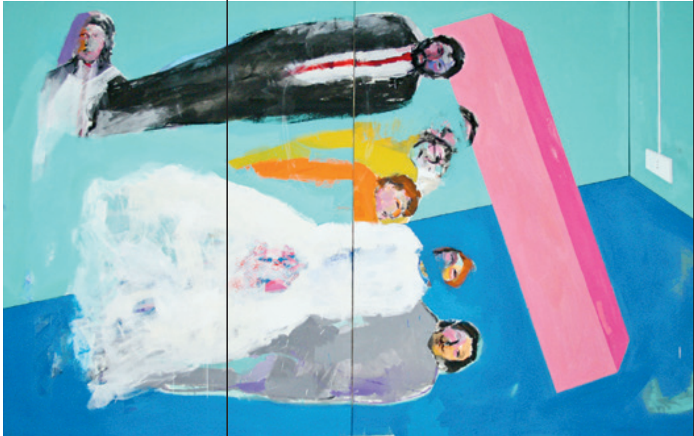
Fadi Al-Hamwi / +90 verdrehte Hochzeit, Mixed Media auf Leinwand, 300 × 200 cm (2010)