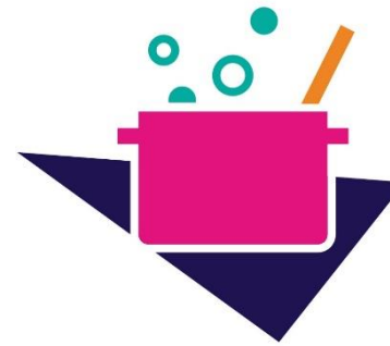
Policy Kitchen - Digitalisierungspolitik