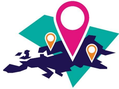
Jung & gesprächig - Veranstaltungsreihe