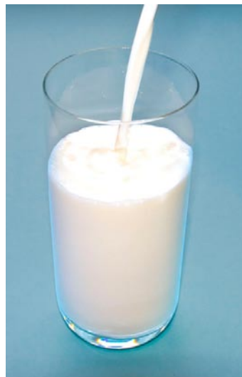
1 Glas Milch (200ml)