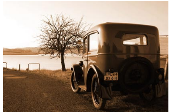
Produktion eines PKWs