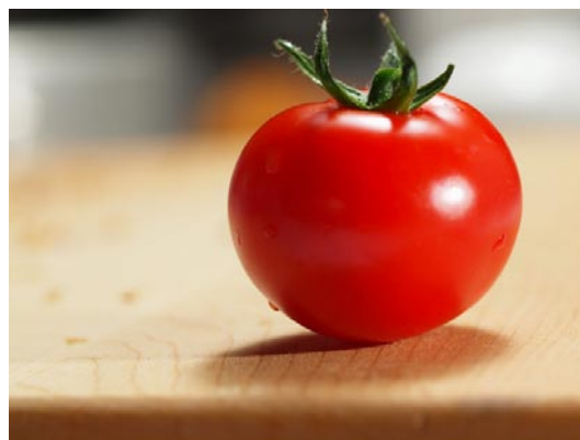
1 Tomate (70 g)