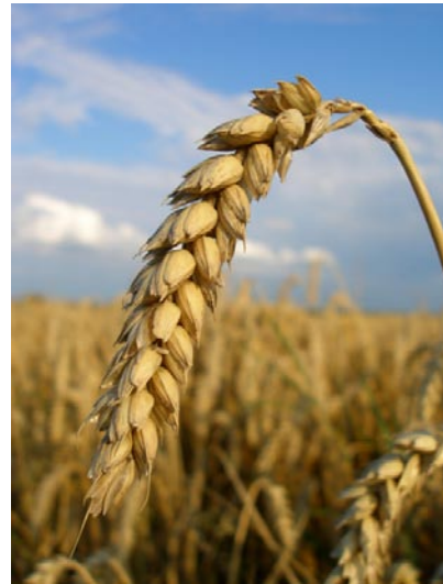
1 kg Weizen