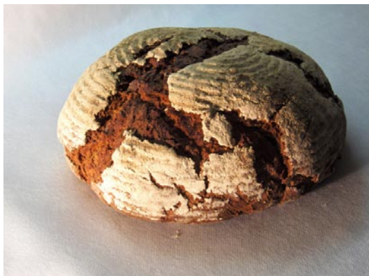
1 kg Brot