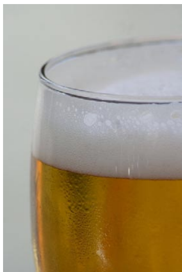
0,2 l Bier