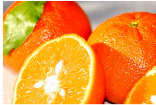
1 kg Orangen