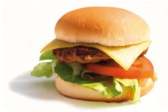
1 Hamburger (150 g)