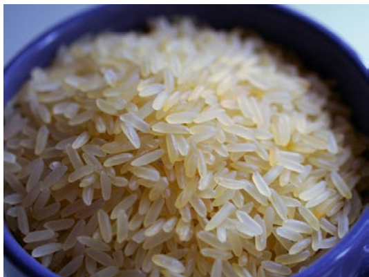
1 kg Reis