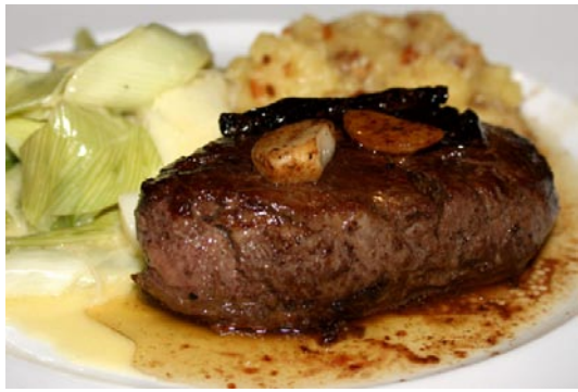
1 kg Rindfleisch