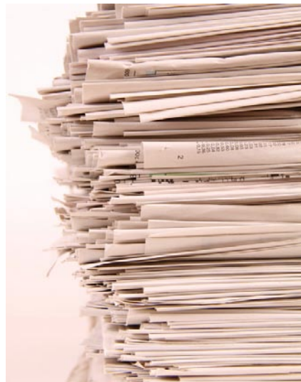
1 Blatt Papier