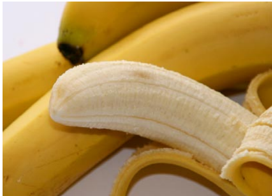
1 kg Bananen