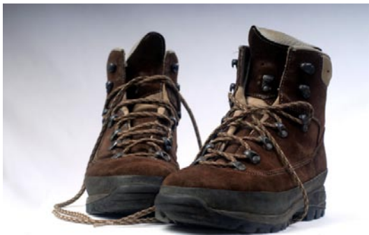
1 Paar Schuhe (Rinderleder)