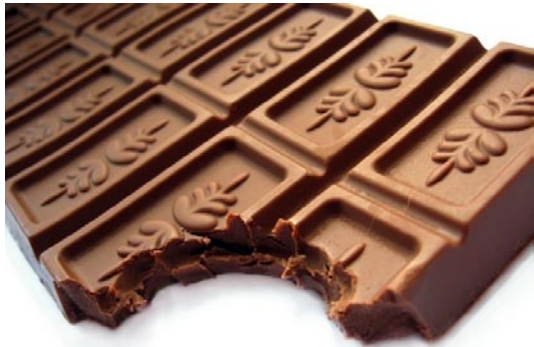
1 kg Kakao