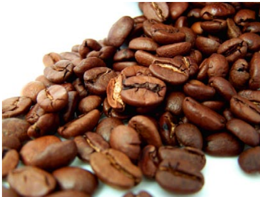
1 kg Kaffee