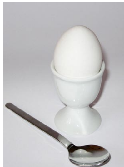
1 kg Hühnereier (1 Ei = ca. 40-70 g)